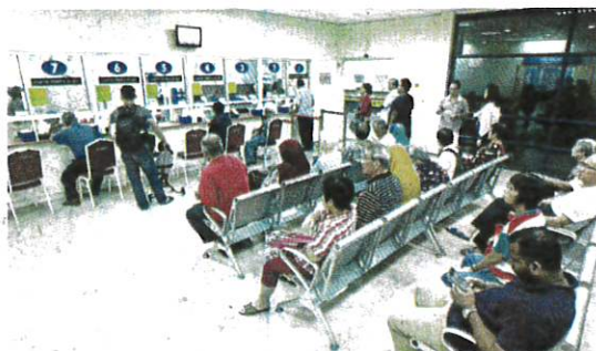
Gabungan pelbagai faktor menyebabkan penjagaan kesihatan awam berdepan isu memberi perkhidmatan terbaik untuk rakyat. (Foto hiasan)

"Seramai 51 responden (46 peratus) menyatakan fasiliti kesihatan memerlukan peningkatan sehingga 100 peratus, dengan 18 responden (16 peratus) menyatakan fasiliti kesihatan memerlukan